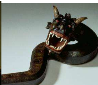
Cornet à bouquin