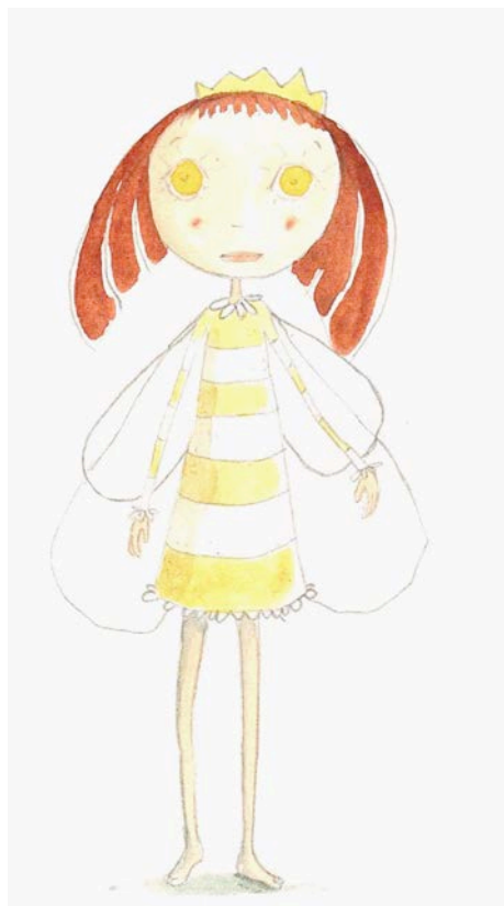
La reine des abeilles